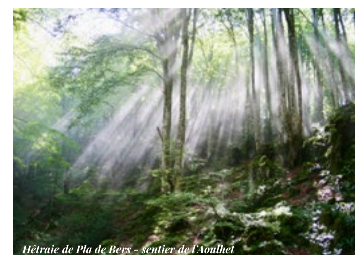
Hêtre de Pla de Bers - sentier de l'Aoulhet